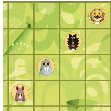
Nej, det går ikke

Herefter tager man et nyt kort, så man altid har 2 på hånden, og spillet fortætter med næste spiller. Hvis man, efter at have spillet, har lavet en linje, som svarer til linjen på en anden spillers kort, viser sidstnævnte sit kort til de andre spillere med det samme og vinder 1 point. Herefter tager man et nyt kort. Spillet fortsætter som før.